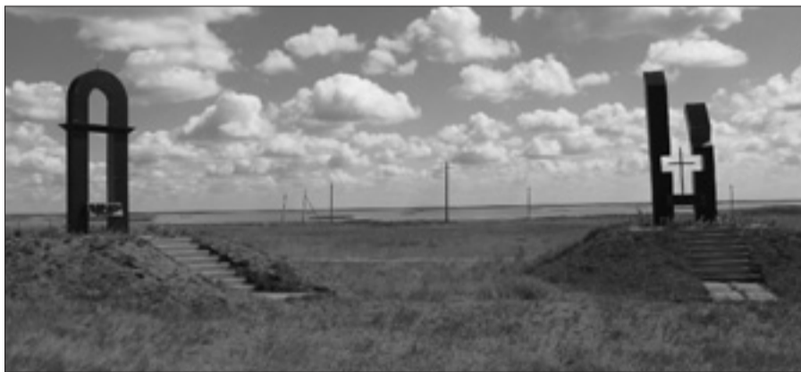
Памятники на месте предполагаемых захоронений вблизи Голого озера

Первых женщин привезли в феврале 38, их гоняли рубить на озере камыш, из которого месили саман для строительства бараков (глина с камышом). Им же топили печи. Рядом со строящимся лагерем был расположен казахский поселок, название которого в переводе звучит как «Голое озеро». Когда колонна женщин проходила мимо, казахские старики и дети кидались в них камнями. Женщины были этим поражены, конвоиры злорадствовали. Пока одна из женщин не споткнулась и не поскользнулась брошенный камень: это оказался курт — специально приготовленный молочный продукт наподобие творога или сыра, очень твердый, который можно долго хранить. Оказывается, местные жители пытались так подкормить женщин. Казахи им очень сочувствовали и чем могли — помогали.